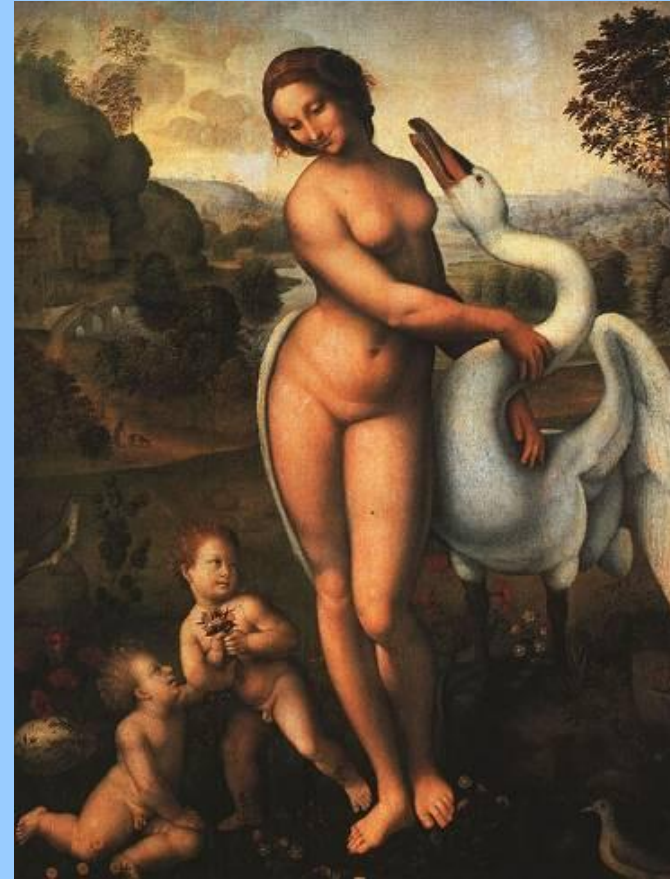
Леда с лебедем. Леонардо да Винчи