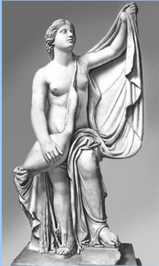
«Леда с лебедем». Римская мраморная копия с греческого оригинала скульптора Тимофея. 4 в. до н. э. Вилла Альбани. Рим.

Жена спартанского царя Тиндарея, Леда, покорила своей красотой верховного бога Зевса, который сочелся с ней в образе лебедя. От этого союза Леда родила яйцо, из которого появилась Елена – получеловек, полу – лебедь. Елена отличалась чарующей красотой, за что её похитил Парис, дав повод к Троянской войне.