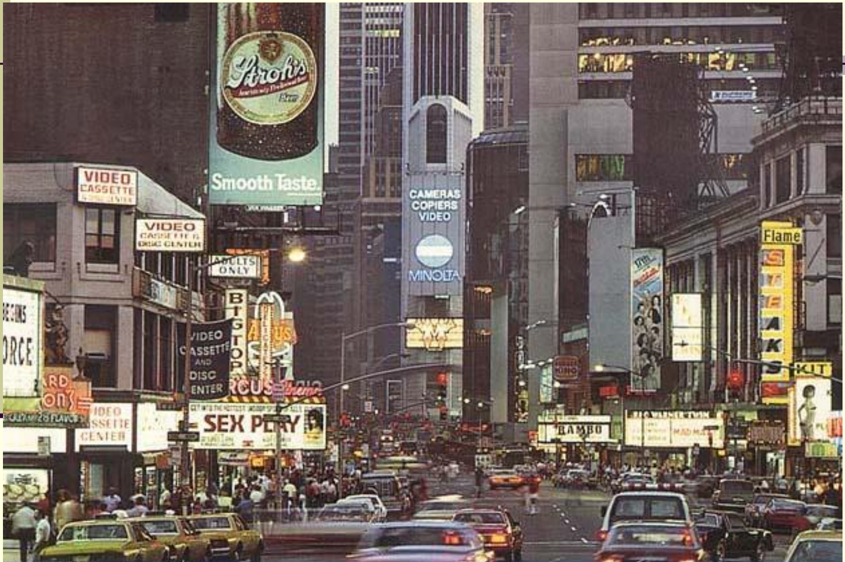
Ночной Нью-Йорк. Тайм-сквер.