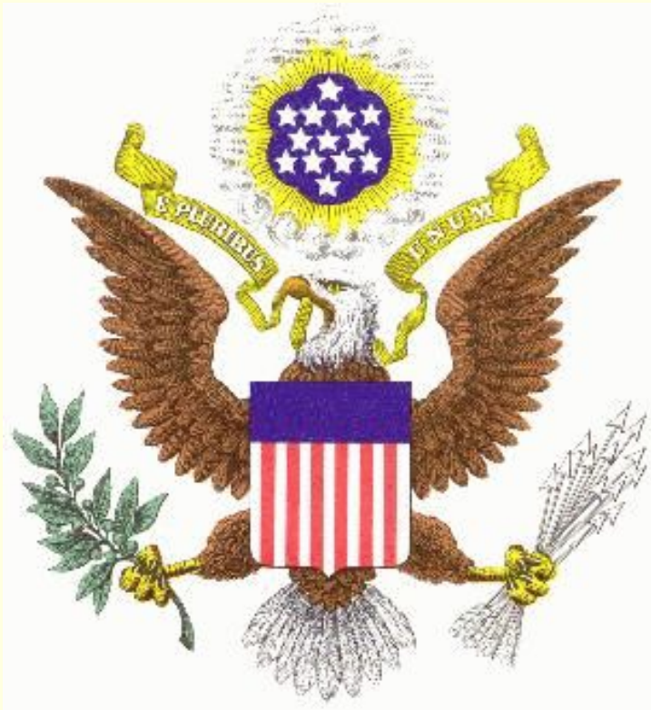
The symbol of the USA is the bold Eagle