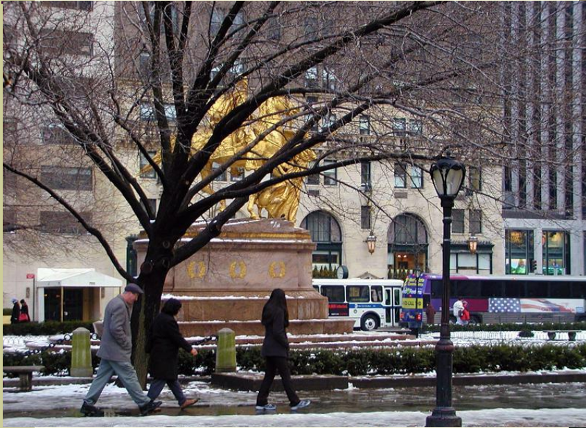
the Fifth Avenue