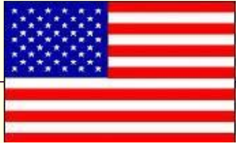
The flag of the USA -Stars and Stripes .