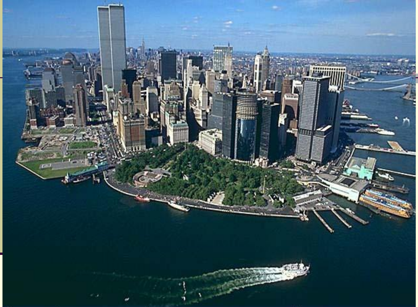
Манхэттен. Южная оконечность. С запада омывается водами реки Гудзон, с востока — Ист-ривер. Слева: небоскребы-близнецы — 110-этажные башни Центра международной торговли (1971-1973, разрушены 11 сентября 2001); справа, на заднем плане — Бруклинский мост.