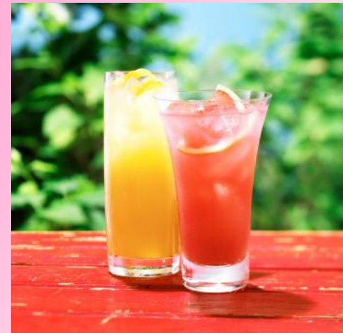
Two glasses of juice