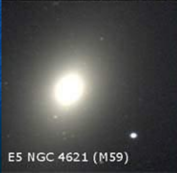
E5 NGC 4621 (M59)