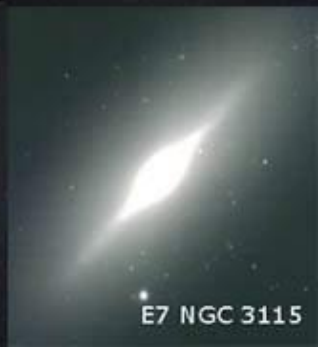
E7 NGC 3115