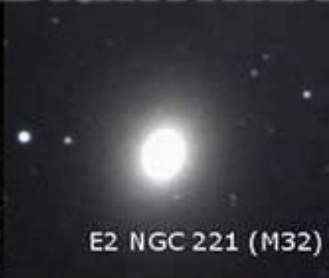
E2 NGC 221 (M32)