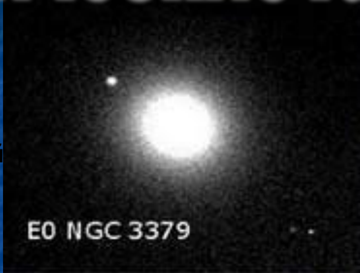
E0 NGC 3379

Эллиптические галактики обозначаются буквой E, имеют разную степень сжатия: от круглых (E0) до сильно сжатых (E7). Заметное вращение наблюдается только у галактик со значительным сжатием.