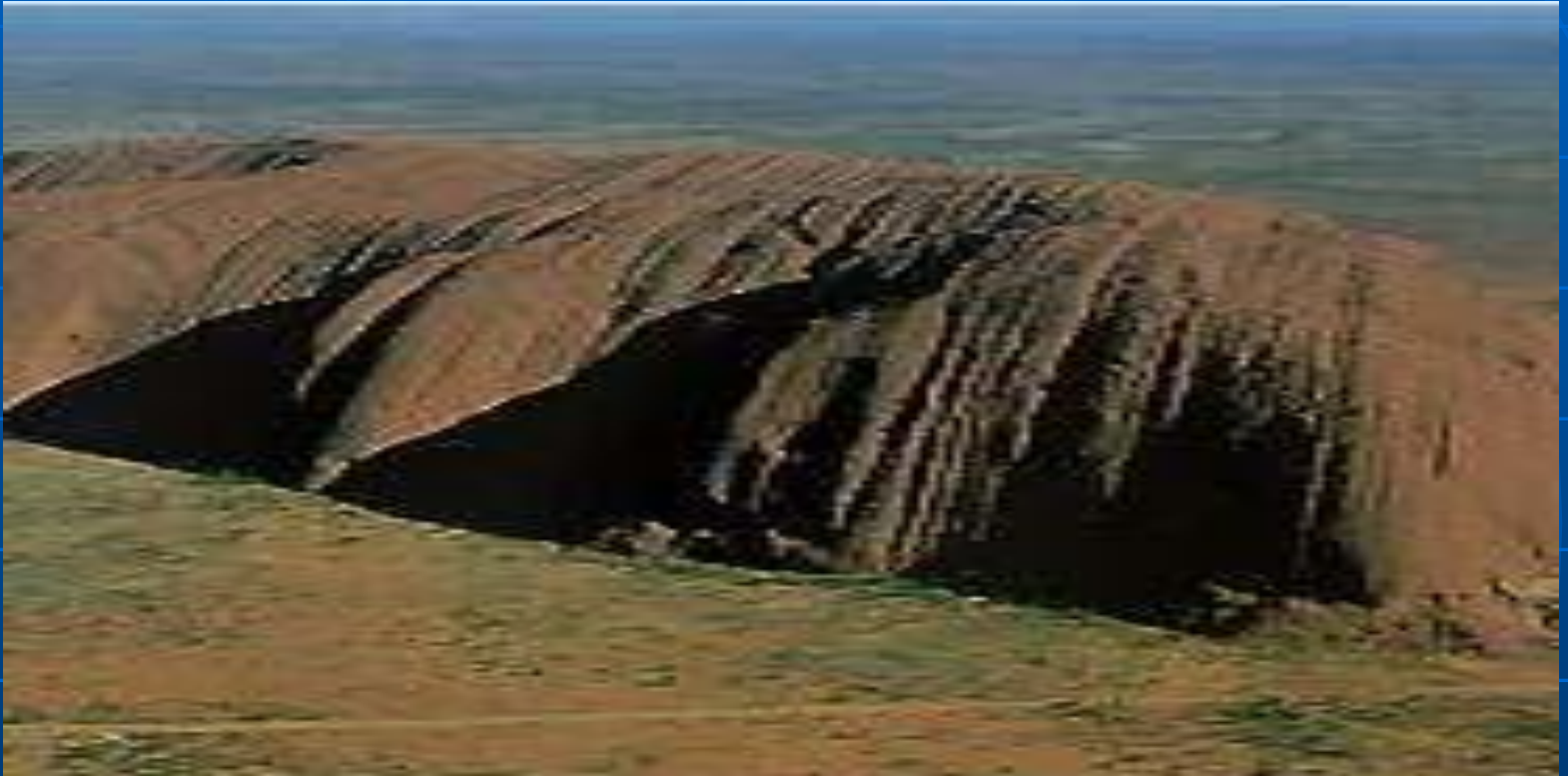
Скала Эйса (Центральная Австралия).