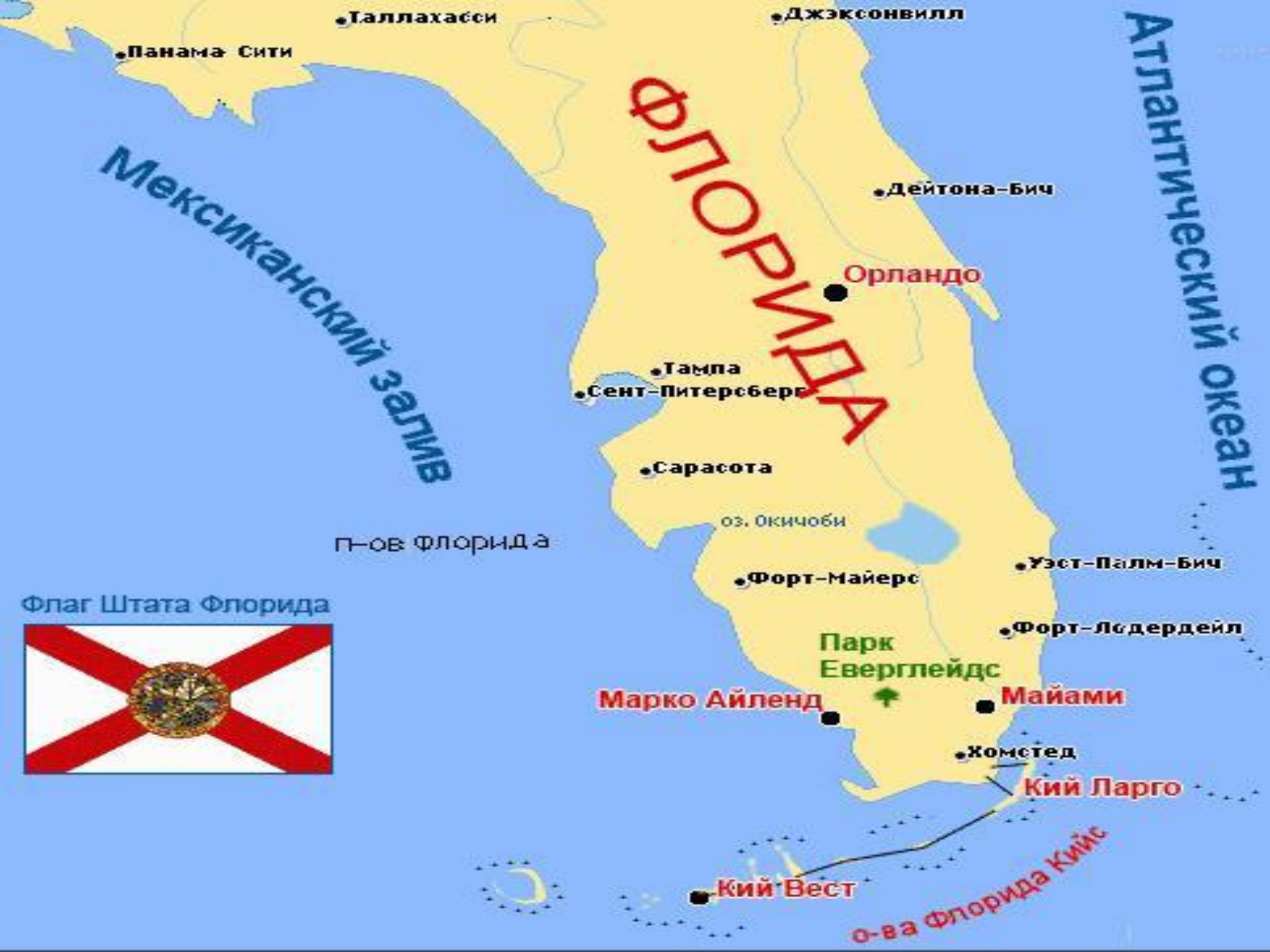
Флаг Штата Флорида