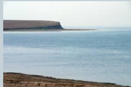
Озеро Маныч-Гудило, одно из водно-болотных угодий России