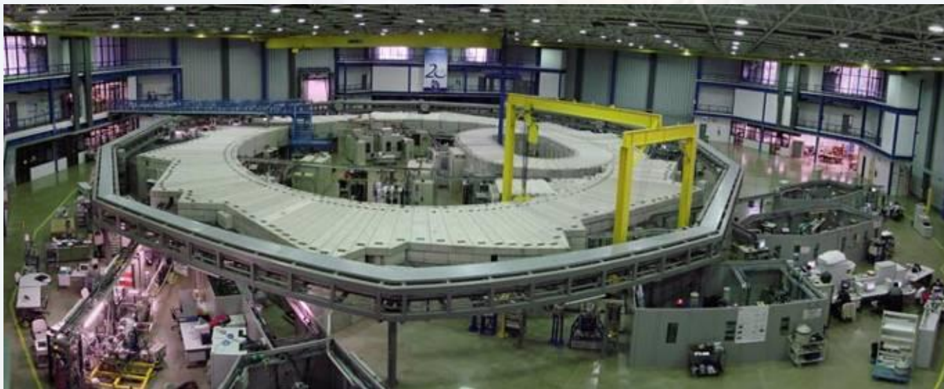
Лаборатория Laboratório Nacional de Luz Síncrotron в городе Кампинас

Наука в Бразилии достигла значительных успехов на международной арене за последние десятилетия. Наукой и техникой в Бразилии заведует Министерство науки и техники, которое включает в себя CNPq (Национальный исследовательский совет) и FINEP (Национальное агентство по финансированию образования и исследований). Это министерство также осуществляет прямой контроль над Национальным институтом космических исследований (Instituto Nacional de Pesquisas Espaciais - INPE), Национальным институтом амазонских исследований (Instituto Nacional de Pesquisas da Amazônia - INPA) и Национальным институтом технологии (Instituto Nacional de Tecnologia - INT). Министерство также контролирует Отдел по управлению в сфере компьютеров и автоматических устройств - Secretaria de Política de Informática e Automação . Министерство создано в марте 1985 года.