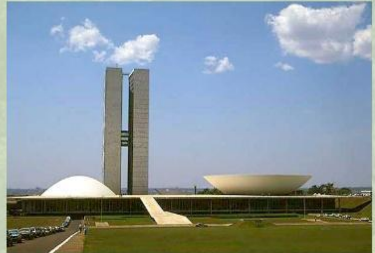
Новая столица Бразилии – город современной архитектуры.

Бразилия - крупнейшее по площади и численности населения государство материка, занимающее по этим показателям пятое место в мире. Название страны связывают с мифическим островом Бразил, где растет красное дерево. С XVI по XIX вв. страна была португальской колонией.