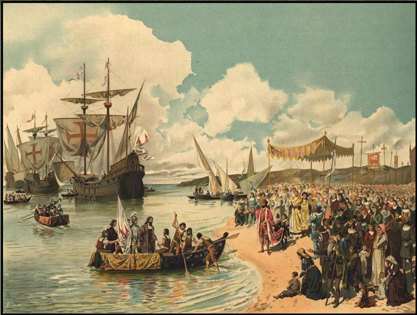
Отплытие Васко да Гамы в Индию