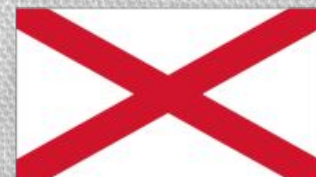
Флаг Св.Патрика Ирландия