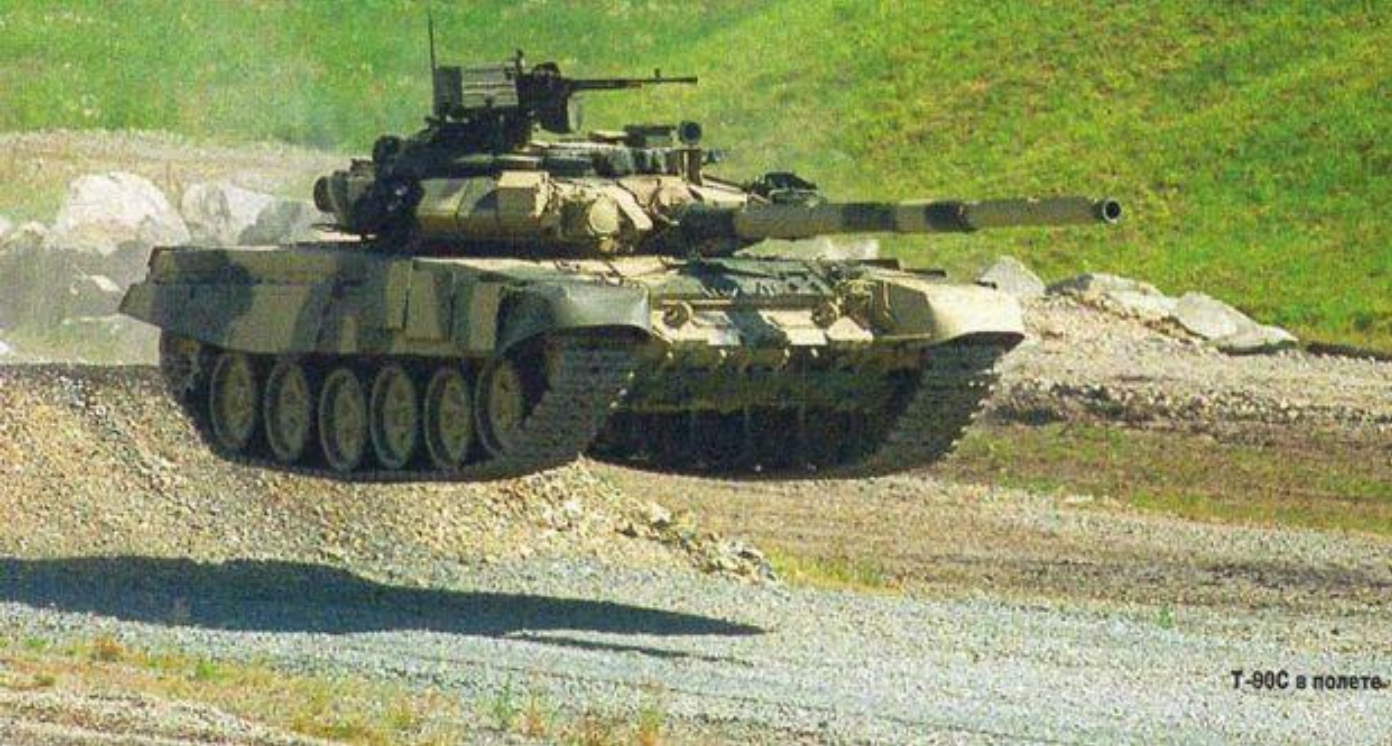
T-90C в полете