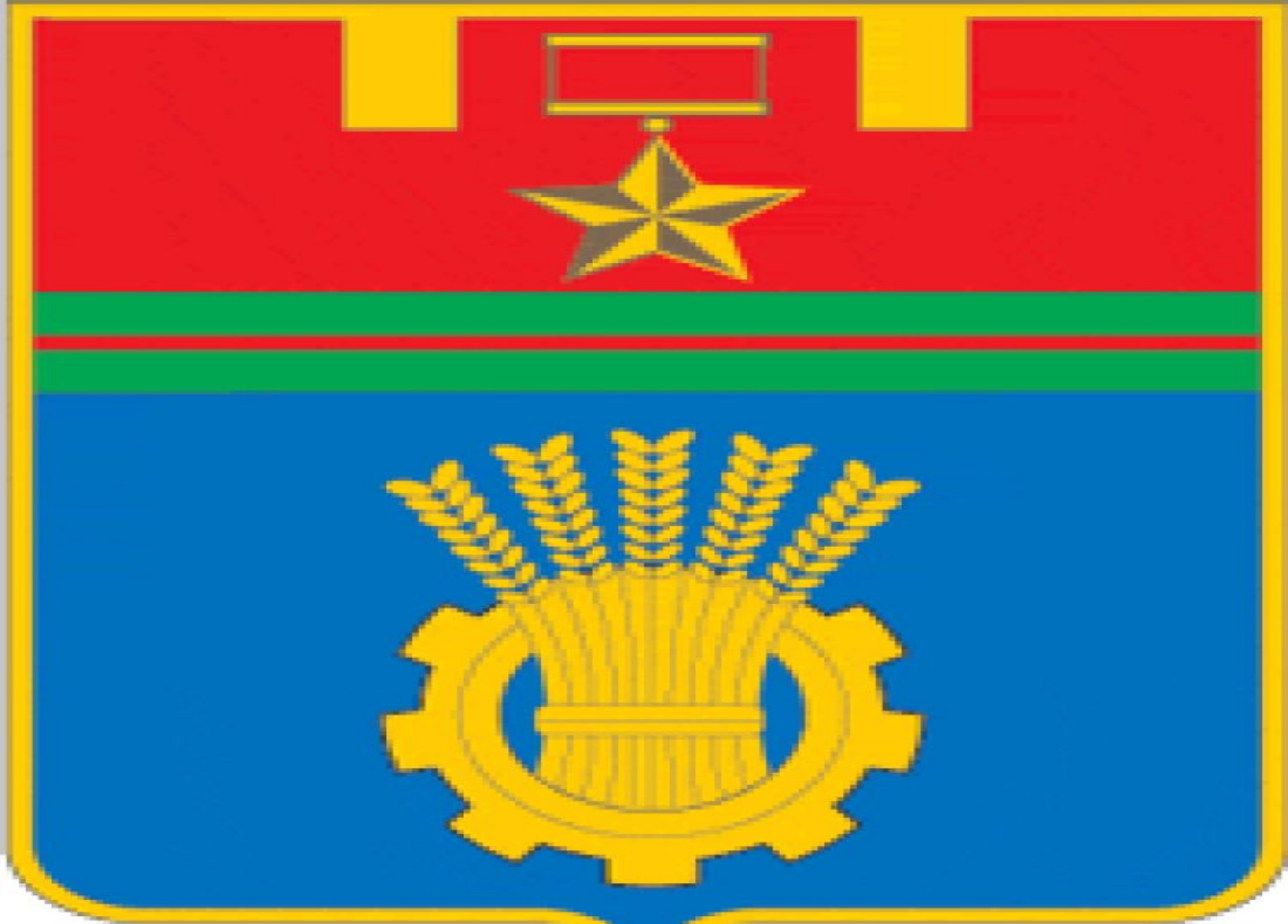
ГЕРБ ГОРОДА ВОЛГОГРАДА