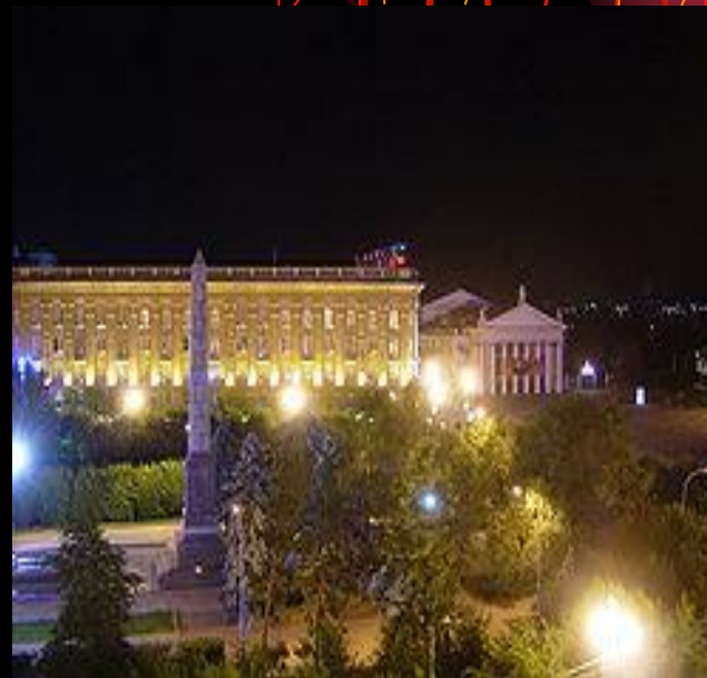
Обелиск защитникам «Красного Царицына» на Аллее Героев