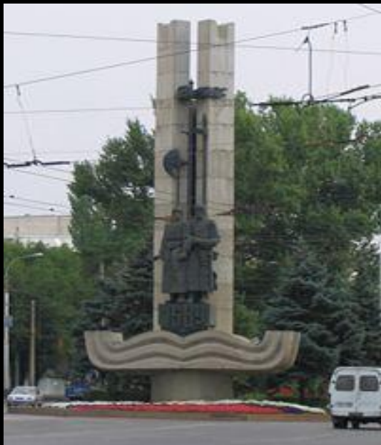
Памятник в честь основания Царицына на пересечении проспекта Ленина и ул. Краснознаменной