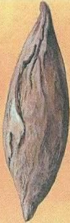
Бомба в форме веретена