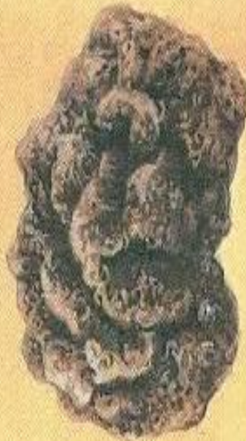
Бомба в виде цветной капусты