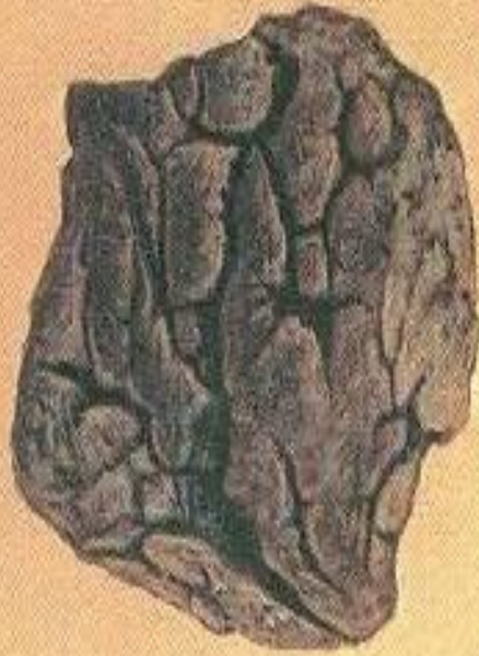
Бомба в виде хлебной корки