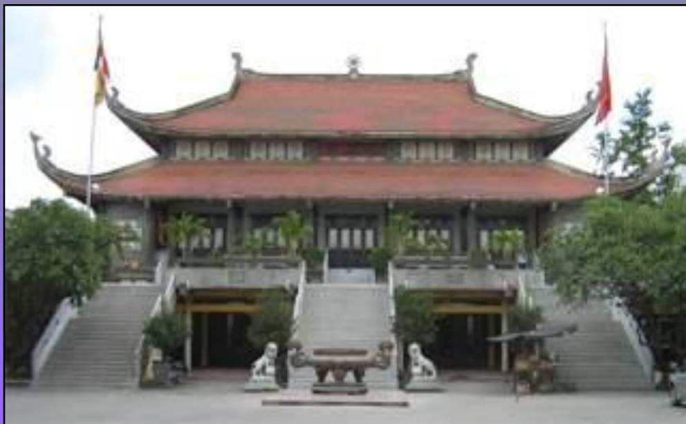
Действующая буддийская пагода в г.Хошимине