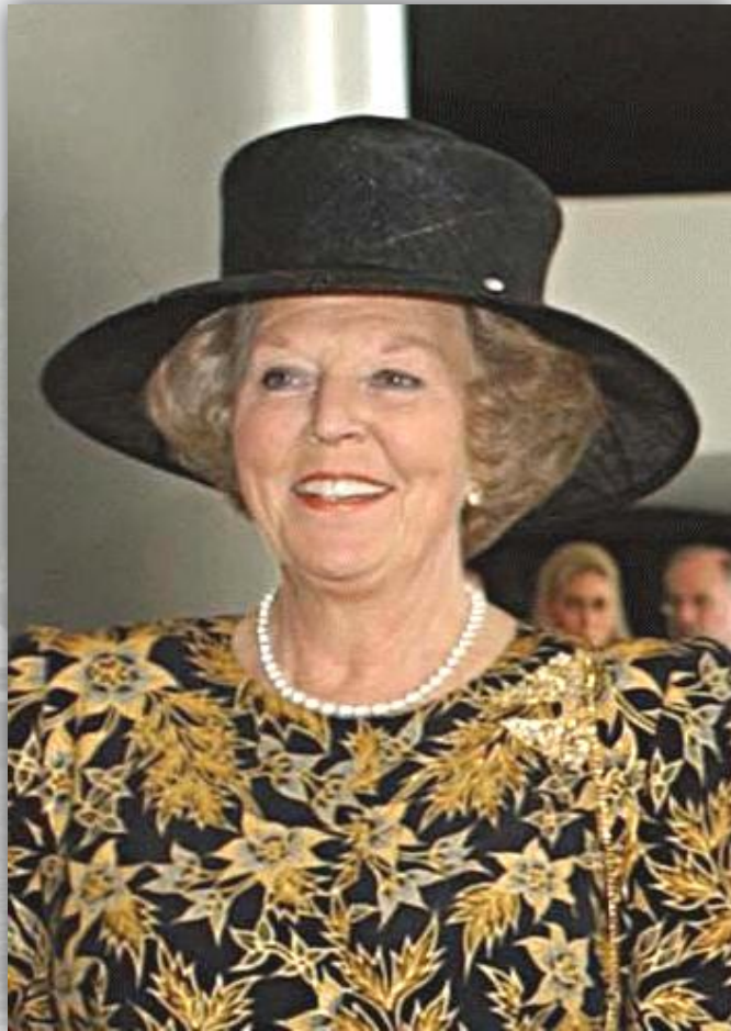
Королева Беатрикс официально является главой государства