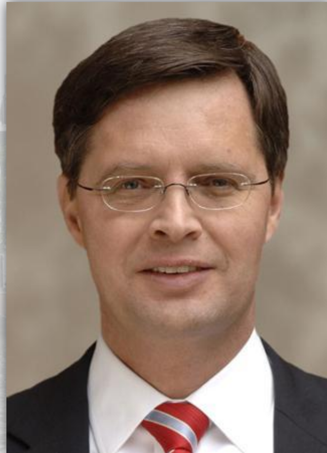
Исполнительная власть принадлежит правительству во главе с премьер-министром Балкененде