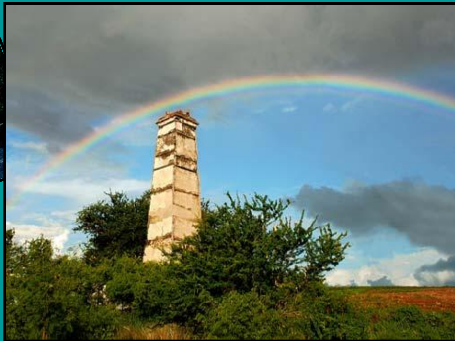
Сахарница Индийского океана – остров Маврикий