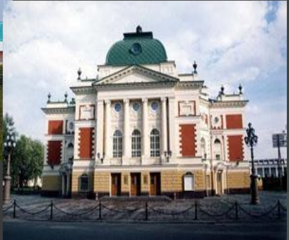
Драматический театр имени Н. П.Охлопкого