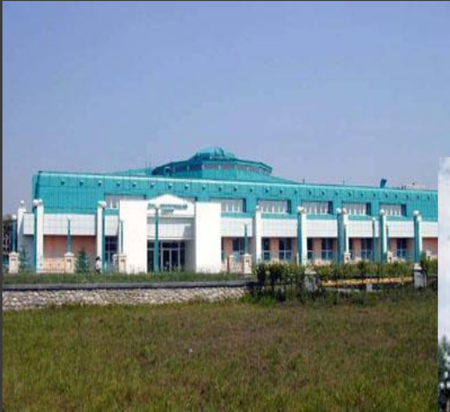
Здание современного медицинского центра