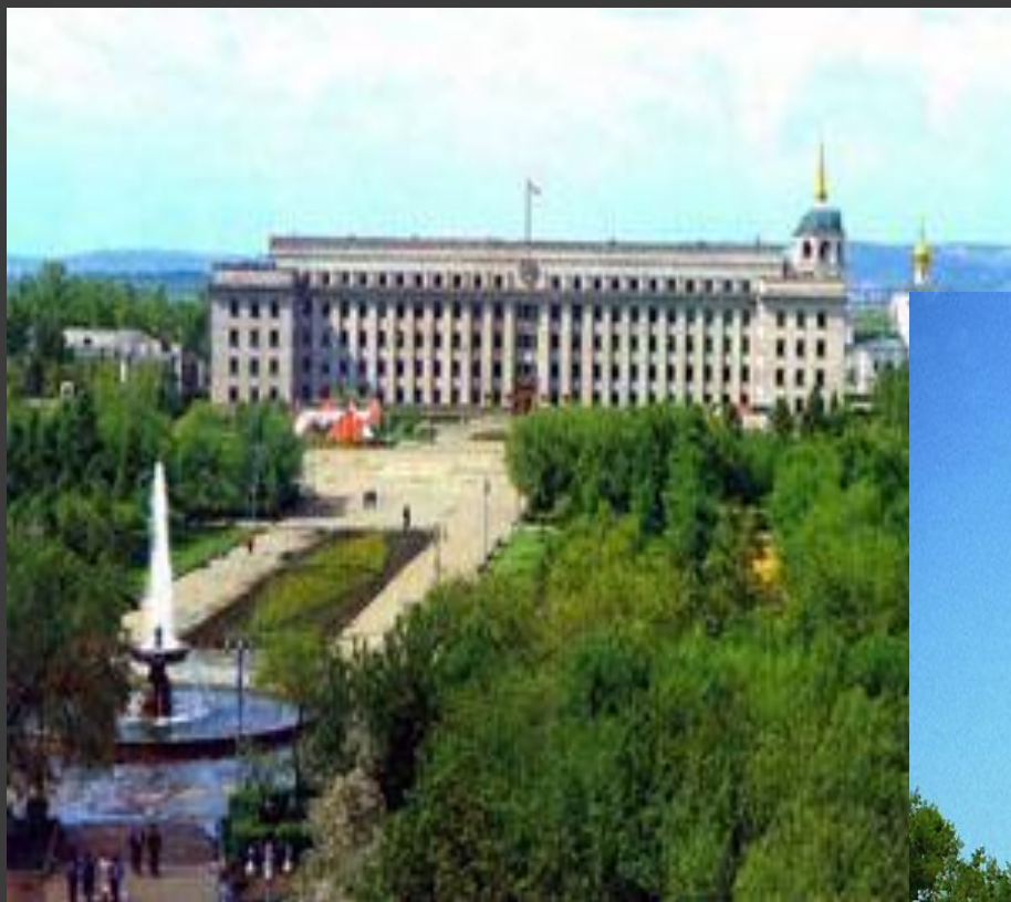
Здание областной Администрации