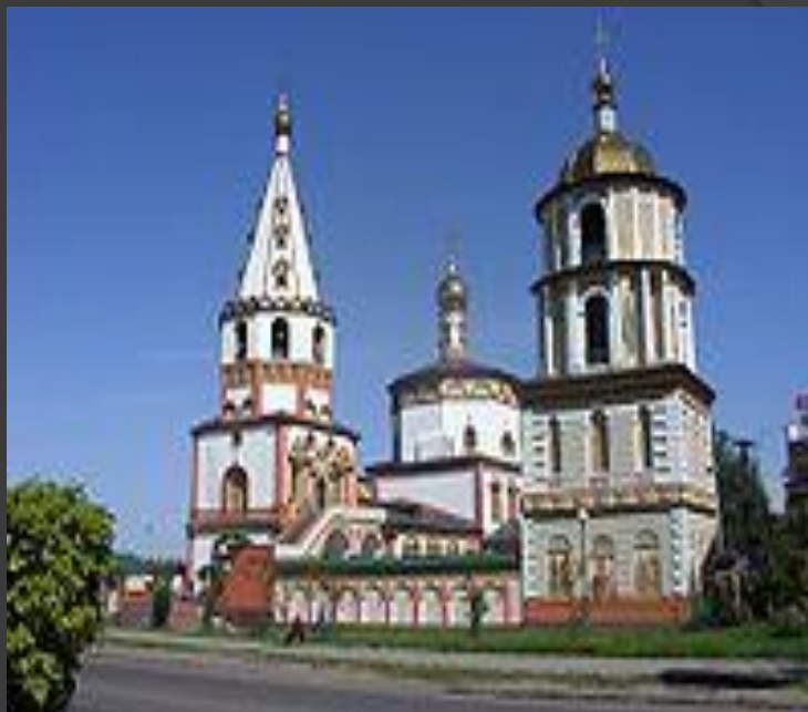
Иркутский православный Собор Богоявления