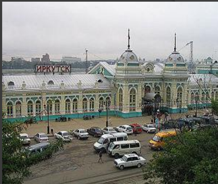
Железнодорожный вокзал в Иркутске