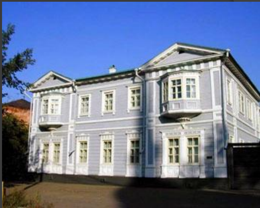
Дом-музей декабристов Волконских