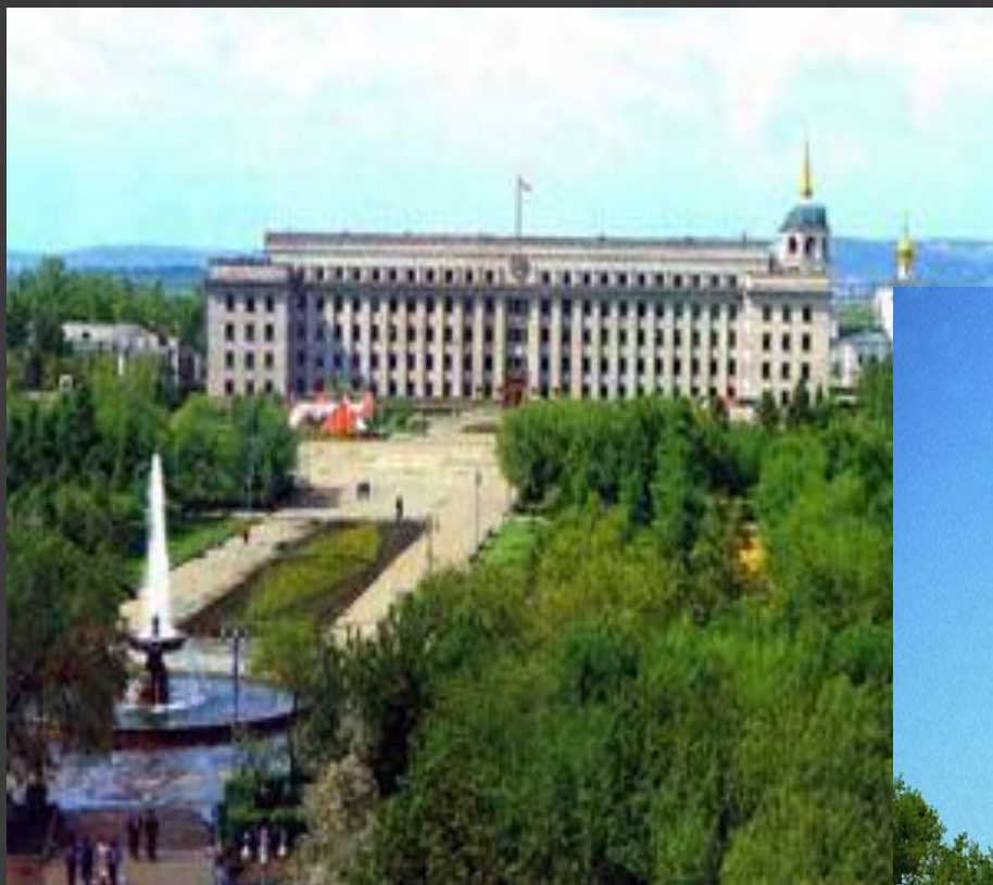
Здание областной Администрации