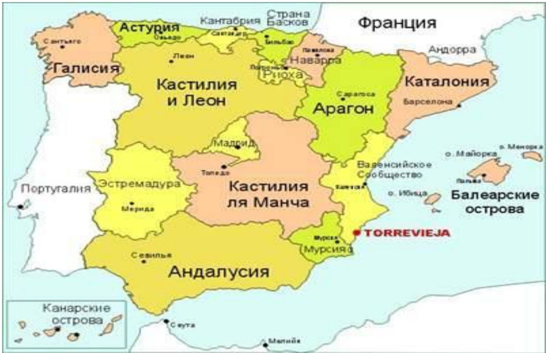
Карта районов Испании