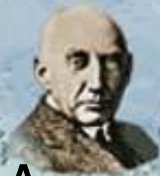
Р. Адмунсен 1912 г.