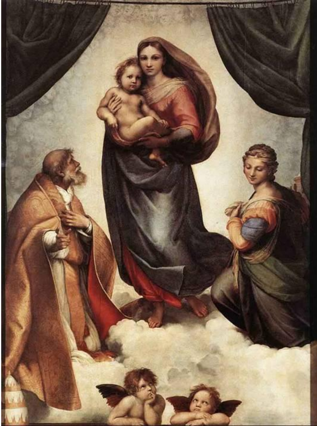
Сикстинская Мадонна. Рафаэль