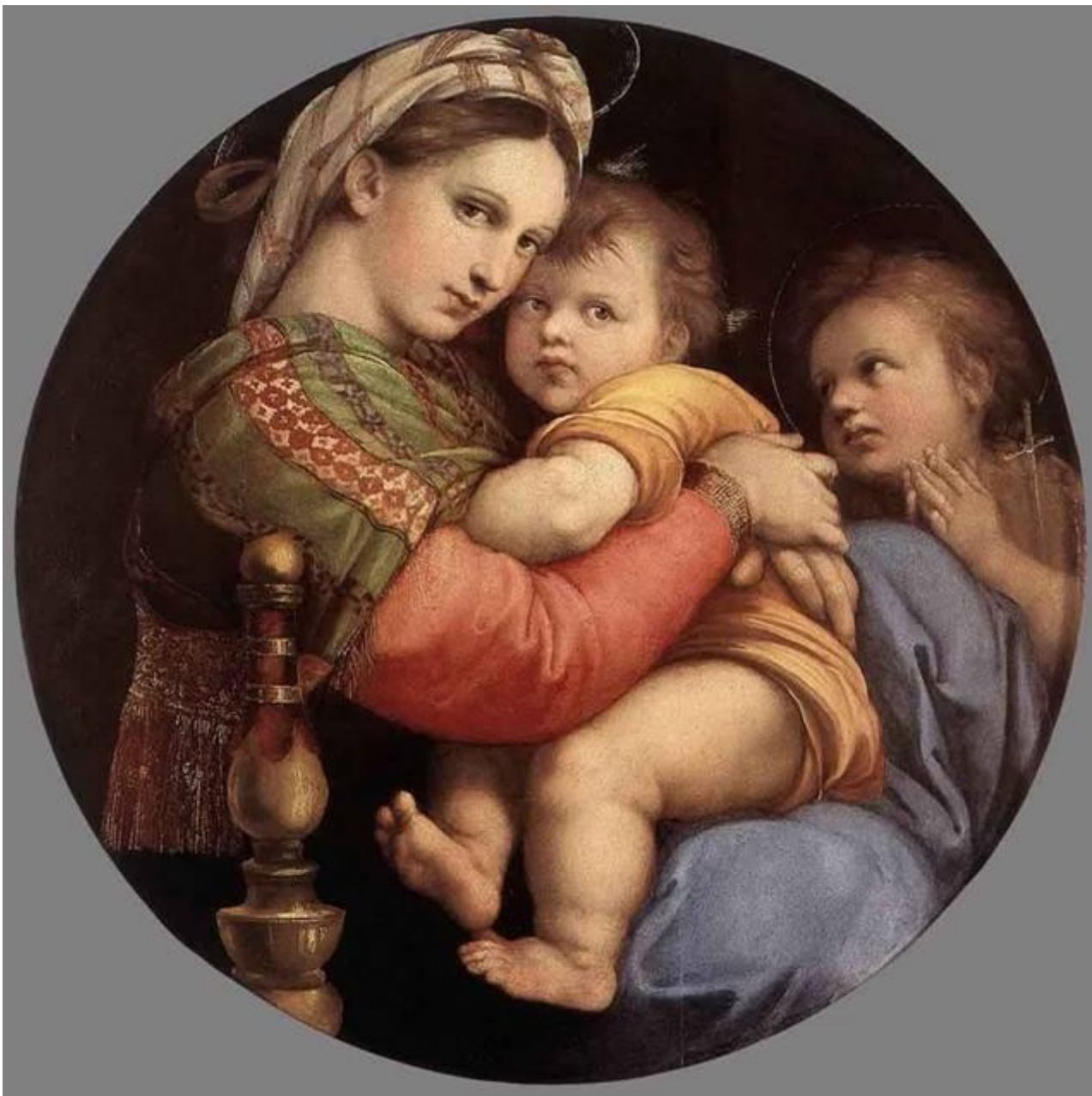
Мадонна с ребёнком. Рафаэль