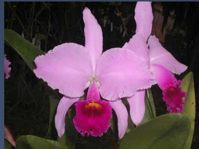
Орхидея Cattleya trianae