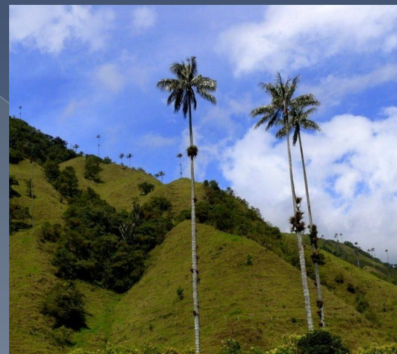
Пальмы Ceroxylon quindiuense