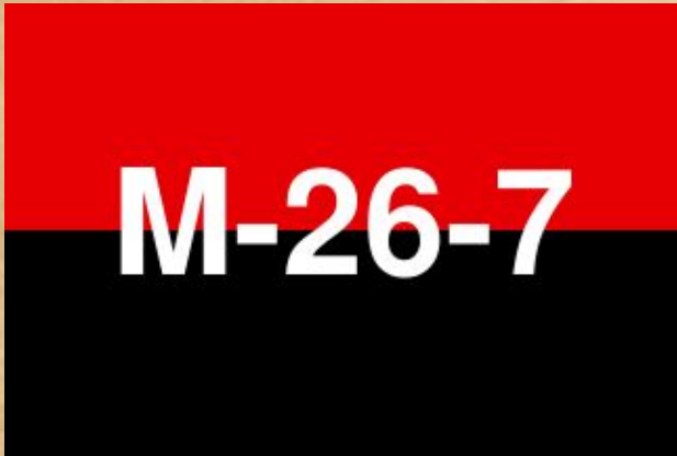
Флаг «Движения 26 июля»

Братья Кастро эмигрировали в Мексику, где они не оставили планов по свержению диктатуры Батиста и начали создавать организацию для будущего революционного выступления, известную как М-26. В Мексике, к тому времени произошла встреча Кастро и Эрнесто Гевары, который вступил в ряды М-26.