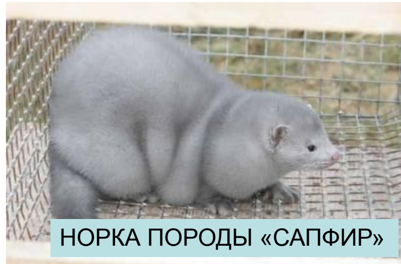
НОРКА ПОРОДЫ «САПФИР»