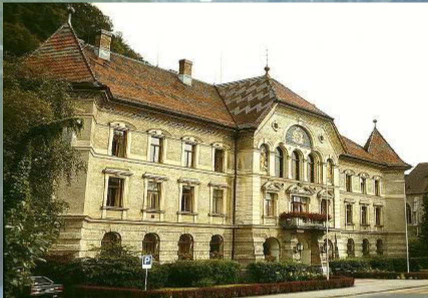
Здание правительства и парламента.

Лихтенштейн — конституционная монархия. Действующая конституция вступила в силу 5 октября 1921 года. Глава государства — Ханс-Адам II, князь фон унд цу Лихтенштейн, герцог Троппау и Егерндорф, граф Ритберг.