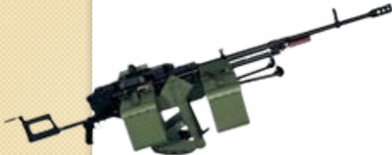
Пулемет калибра 12,7