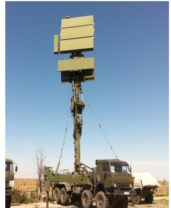
Станция для обнаружения и сопровождения воздушных объектов