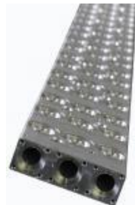
Комплектующие для ГЦ (Демпфер, коллектор)