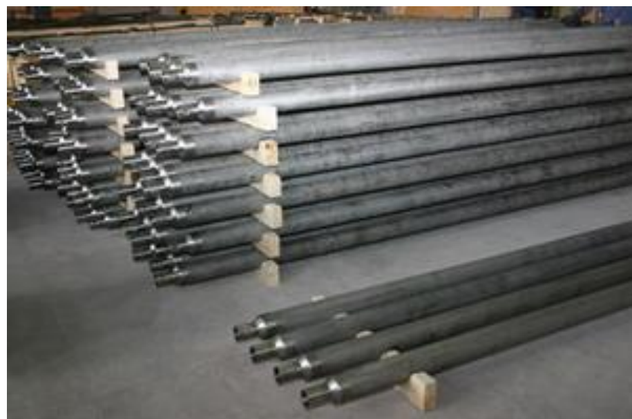
Ампулы для хранения ядерного топлива