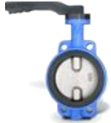
Дисковые поворотные затворы