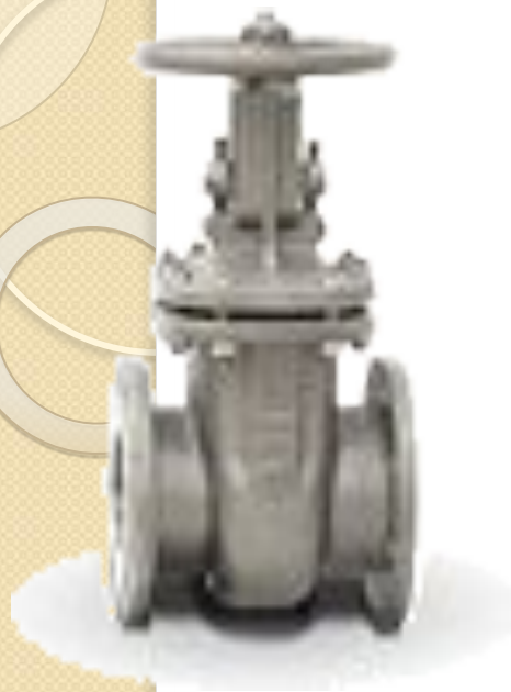
Задвижки стальные литые клиновые