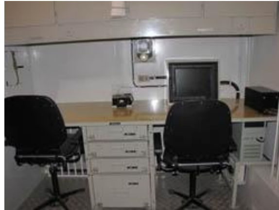
обслуживание металлоконструкций антенных систем радиолокационных станций