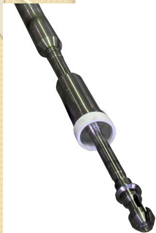
Оборудование для приреакторной зоны (корпус подвески, пробка)