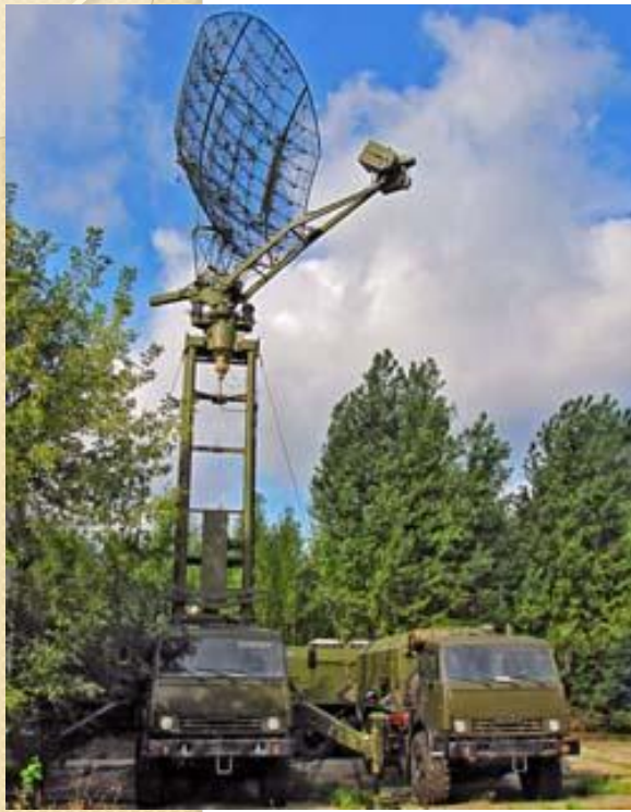
Станция для контроля воздушного пространства