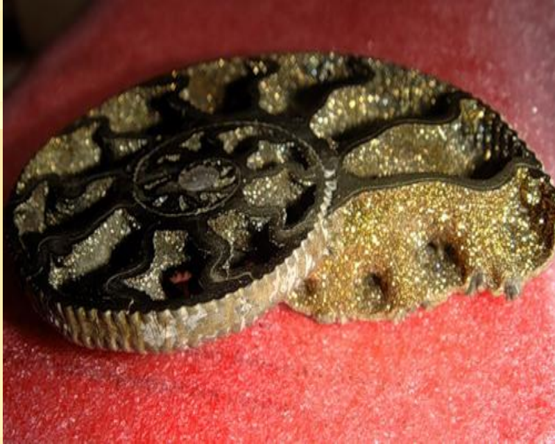
Псевдоморфоза пирита по аммониту