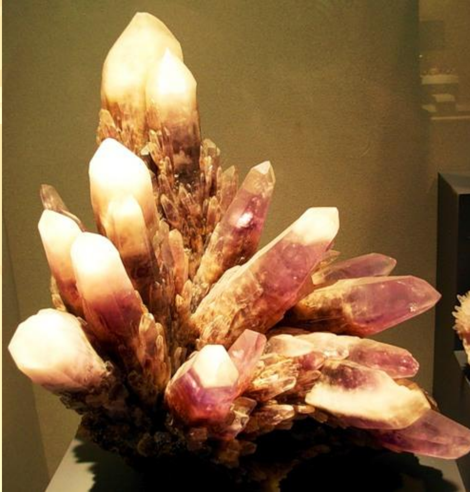
Друза аметистовидного кварца

Друзы-группы кристаллов, приросших к стенкам пустот или трещин.