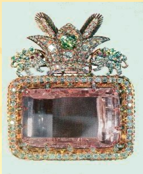
Обработанный алмаз - бриллиант

Свойства минералов определяются их внутренней структурой и химическим составом. Внутренняя структура минералов – это их кристаллическая структура, т.е. кристаллическая решётка и разные расстояния между элементарными частицами в узлах решётки.