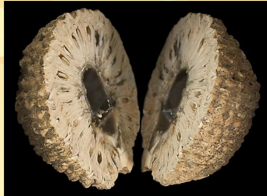
Замещенные халцедоном шишки араукарии юрского периода