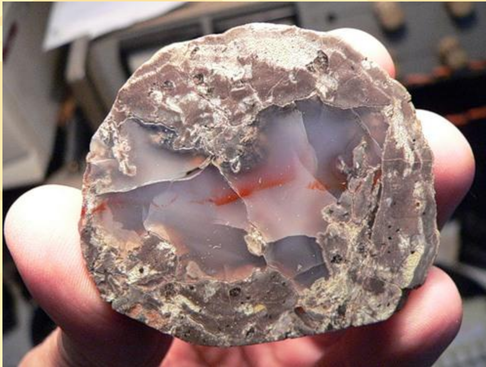
Половинка халцедоновой секреции

Секреции – минеральное вещество, заполнившее какую-либо пустоту в горной породе и обладающее концентрическим строением.