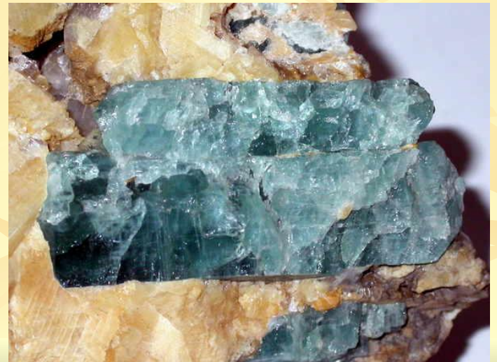
Апатит в кальците