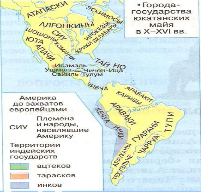
Рис. 1. Расселение индейцев до прихода европейцев

Север Северной Америки и юг Южной (как районы с более суровыми условиями) имеют преобладающее белое население .