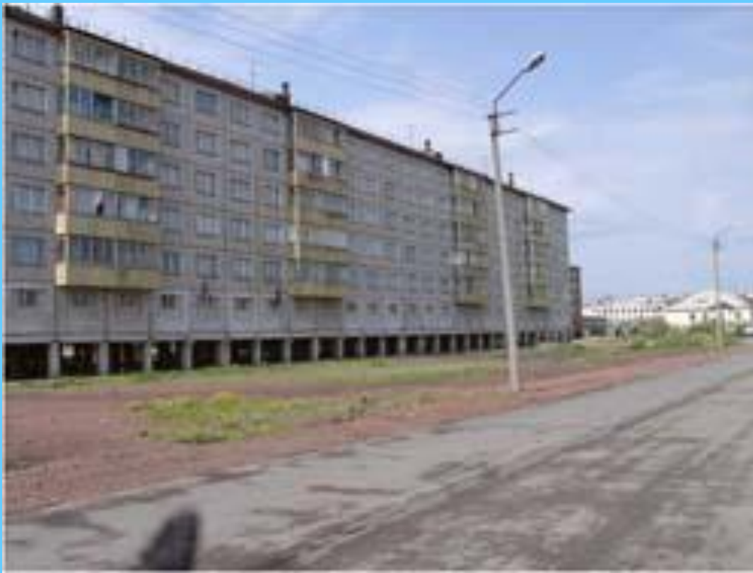
Дома на сваях в Норильске

Как повлияет потепление климата на площадь распространения многолетней мерзлоты? К каким последствиям это может привести?