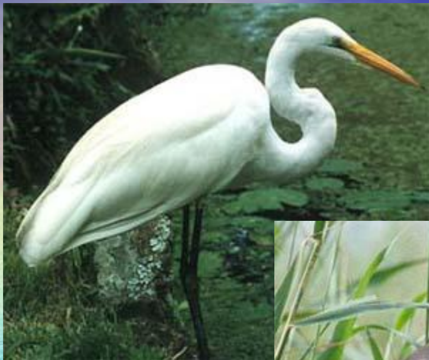
цапля белая малая