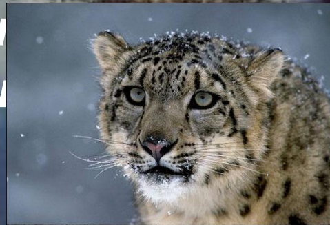
снежный леопард (барс)

Из хищников в горах встречаются леопард, ирбис, снежный барс, бурый медведь, лисица, заяц, белогрудый волк.