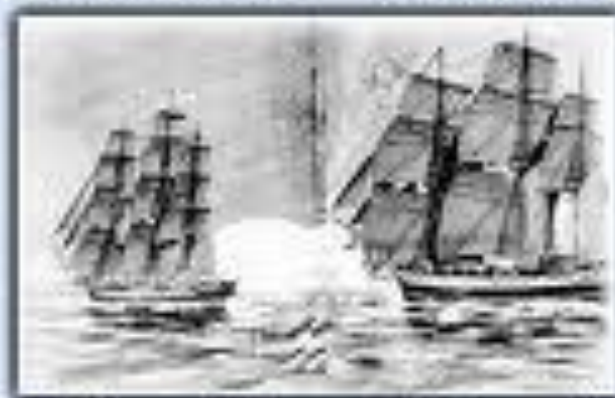
Шлюпы Восток и Мирный