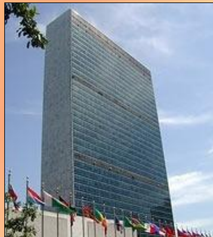
Штаб-квартира ООН в Нью-Йорке

К 2007 году в состав ООН входило 192 государство.