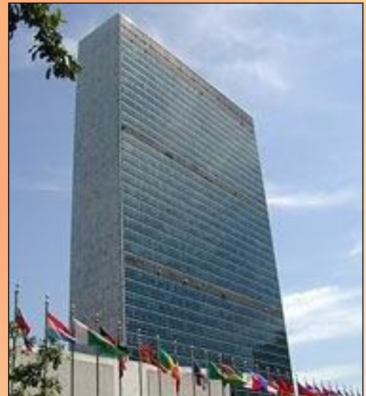
Штаб-квартира ООН в Нью-Йорке

К 2007 году в состав ООН входило 192 государство.