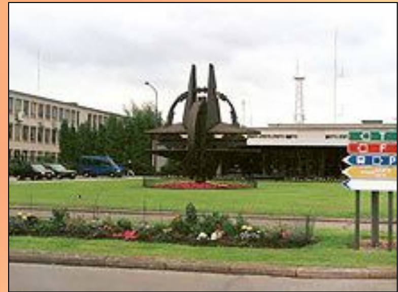
Штаб-квартира НАТО в Брюсселе