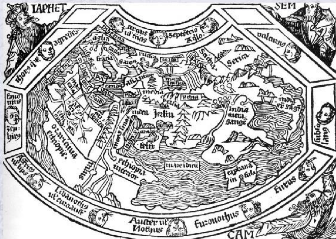
Земля по представлению Птолемея.

Слово география буквально означает «землеописание», так как первые географы описывали и зарисовывали то, что видели в экспедициях. Поэтому веками в географии господствовал описательный метод.