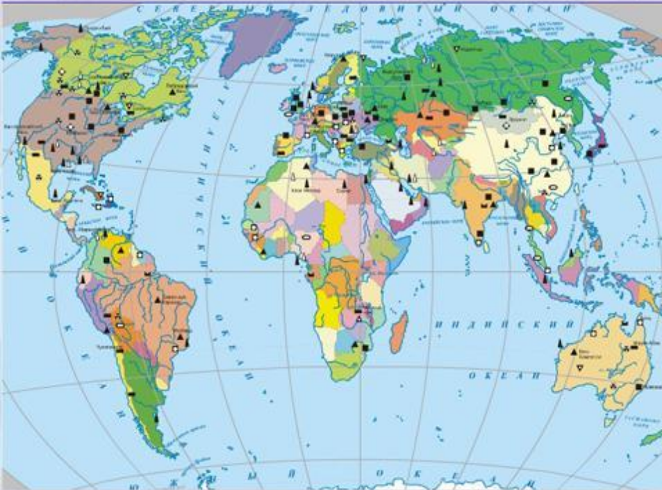
Добывающая промышленность мира

Из-за того что большинство видов природных ресурсов исчерпаемы, вводится показатель ресурсообеспеченности . Для невозобновимых ресурсов (минеральных) ресурсообеспеченность определяется как соотношение объемов годовой добычи минерального сырья к его запасам, то есть показывает, на сколько лет хватит ресурса при текущих темпах его извлечения.