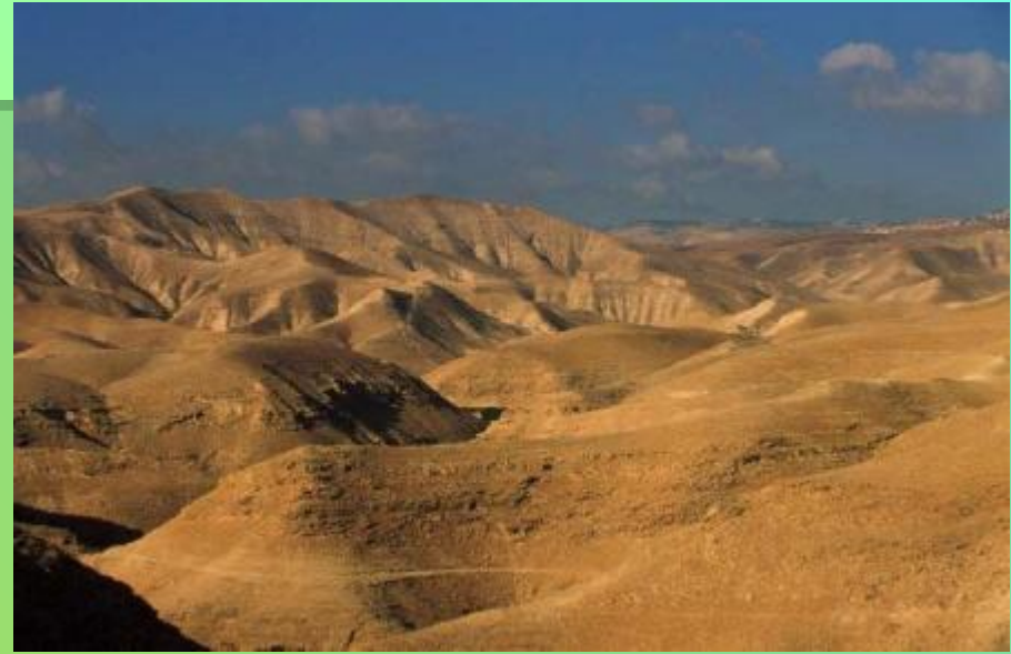
Пустыня в Израиле.