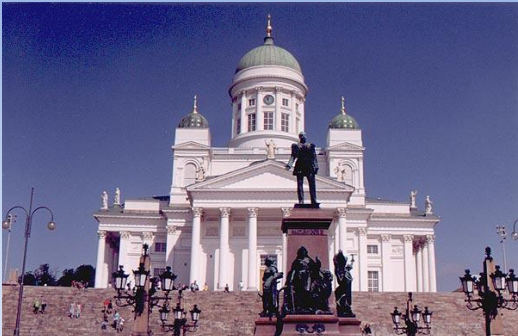
Памятник Александру II на Сенатской площади в Хельсинки