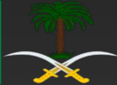
Герб Саудовской Аравии

Девиз: «Нет Бога кроме Аллаха, и Мухаммад - Его пророк.»