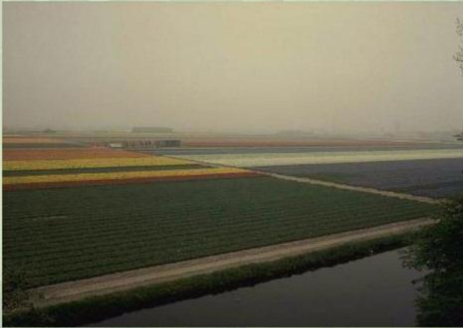
Поля тюльпанов на осушенном морском дне (польдерах) у берегов Голландии.

Низменные пространства на побережье Нидерландов называют маршами . 40% территории этой страны лежат ниже уровня моря, еще 30% - на высоте всего 1 м над уровнем моря.