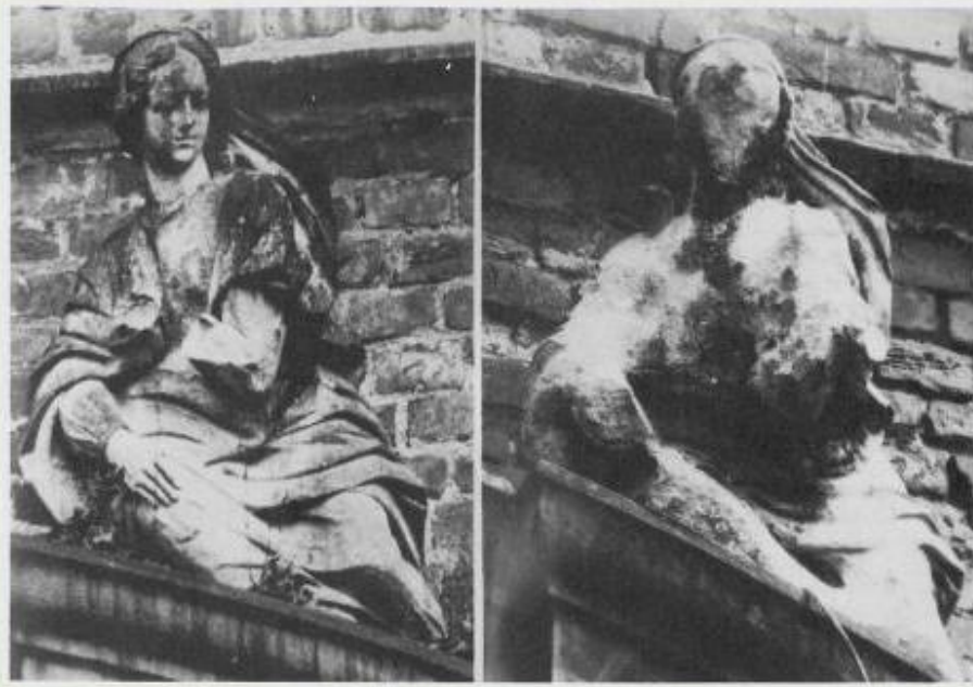
Мраморные статуи до и после кислотных дождей.

Промышленная и городская застройка «съедают» продуктивные земли, транспорт и предприятия энергетики загрязняют воздух и воды. Миллионы тонн серной и азотной кислоты выпадают в виде кислотных дождей , сжигая хвою, листву и ветви деревьев, окисляя почвы, разъедая каменное кружево произведений европейской архитектуры, загрязняют реки. Воды рек и озёр, отравленных промышленными стоками, сегодня подвергаются очистке. В Рейне вновь появилась рыба и, возможно, скоро река будет оправдывать свое название, которое переводится с немецкого языка как «чистый».