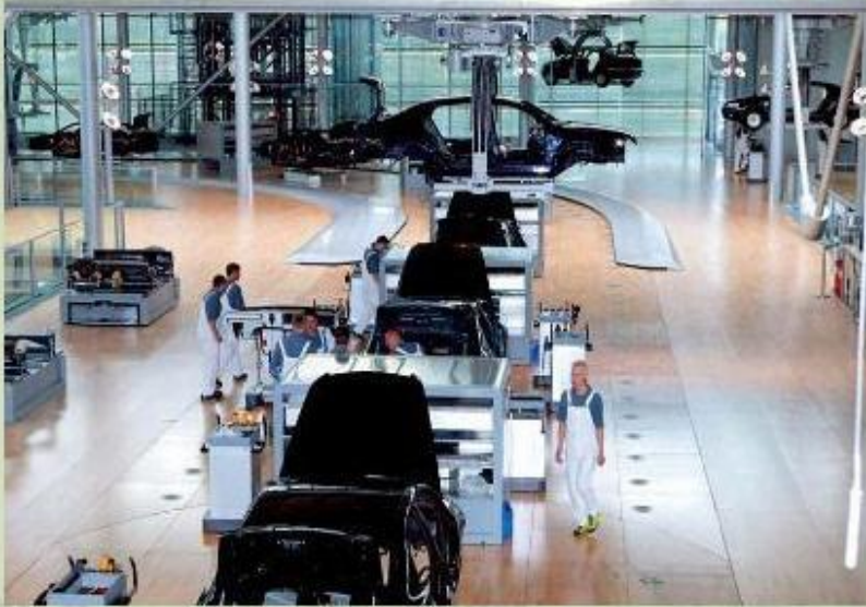
Сборочный цех «Мерседесов» на автомобильном заводе ФРГ.

Каменный уголь и железная руда - основа для развития черной металлургии, крупнейшие предприятия которой («Тиссен и Крупп») возникли еще в XIX веке.