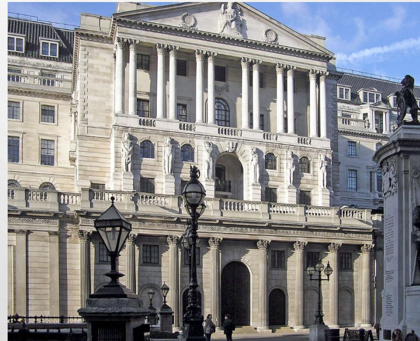
Банк Англии, центральный банк Великобритании.