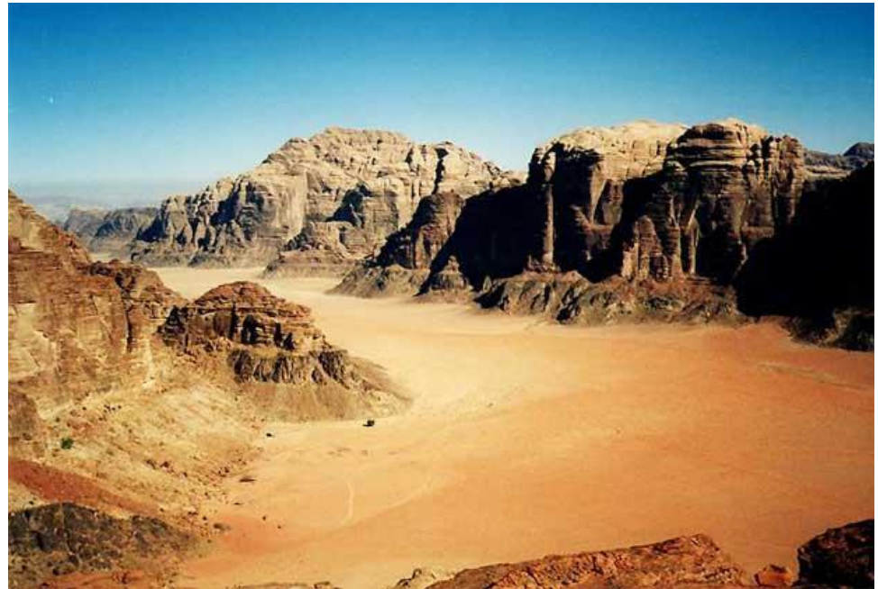
ИОРДАНИЯ , пустыня Вади-Рам

Самый жаркий месяц, как правило, предшествует летнему сезону дождей. В Южной Азии влажный сезон совпадает с летним муссоном, который приносит влагу с Индийского океана, а зимой сюда распространяются континентальные азиатские сухие воздушные массы.