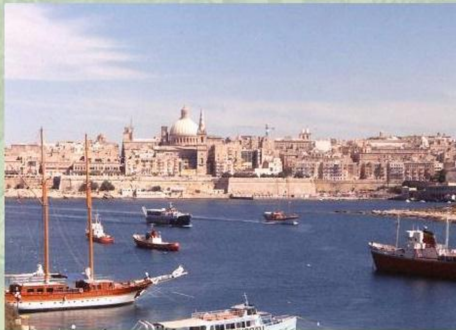
Мальта - «остров-памятник».