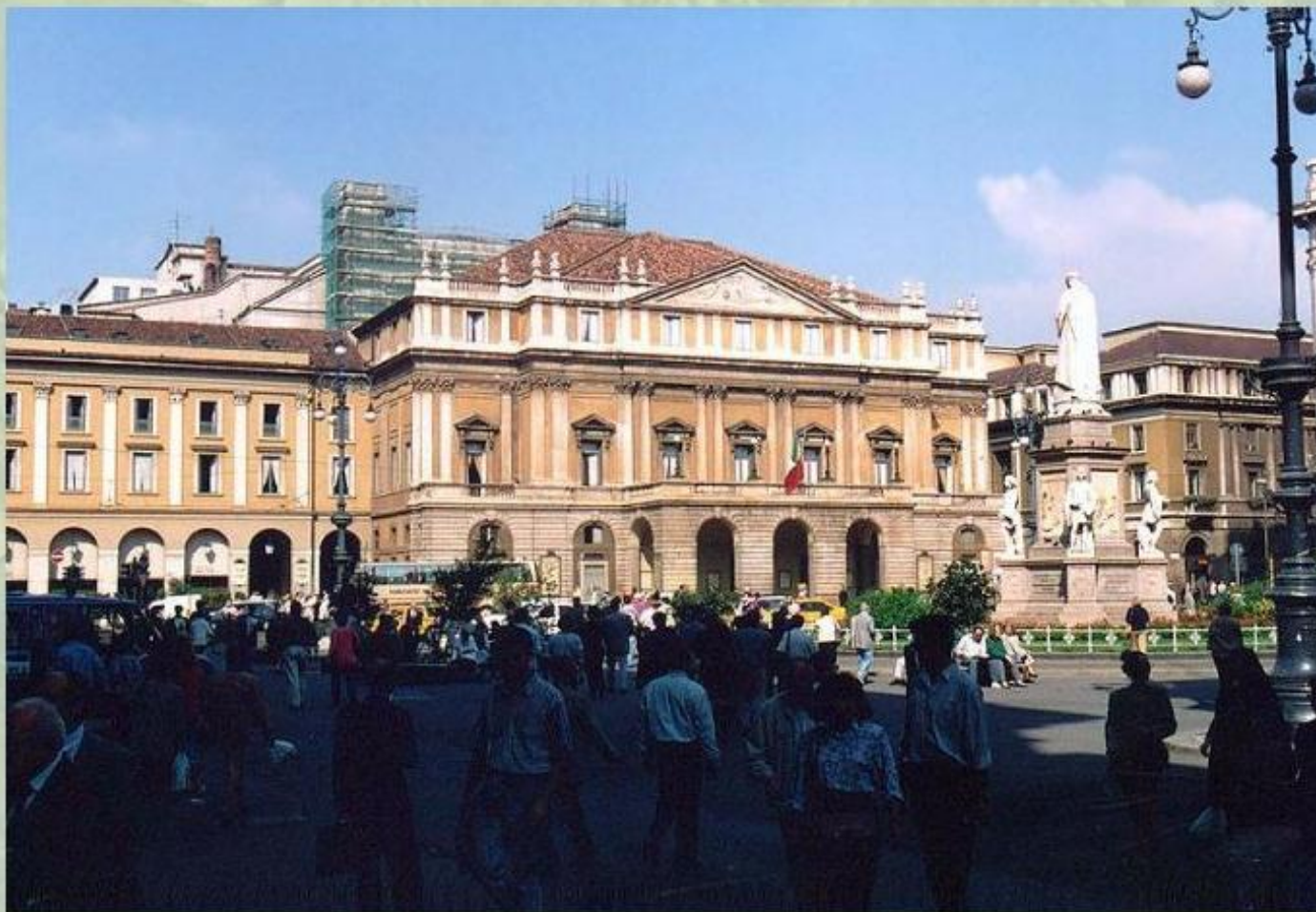
Миланский оперный театр - Ла Скала.