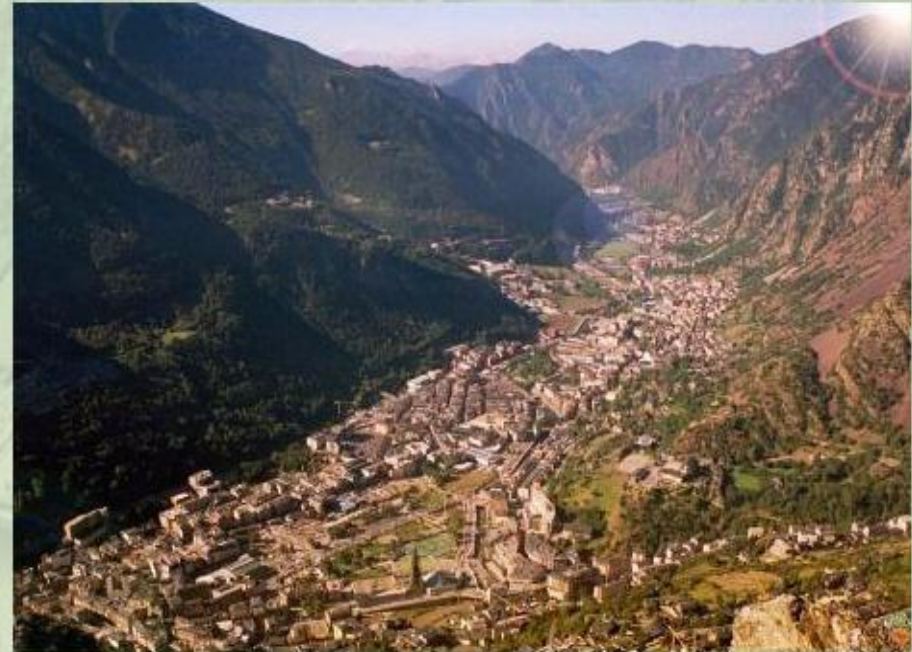
Андорра - небольшое государство в Пиренеях.