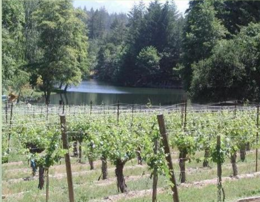
Виноградники в Средиземноморье.

Плодородные земли Паданской равнины в Италии заняты посевами зерновых и овощей. Здесь растут также плодовые деревья и виноградники. На юге страны выращивают маслины и цитрусовые. Италия - мировой экспортер фруктов, вин и оливкового масла.