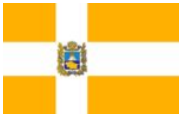
Флаг Ставропольского края