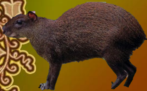
Золотистый заяц агути