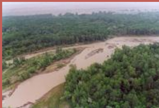
Шарынская ясеневая роща