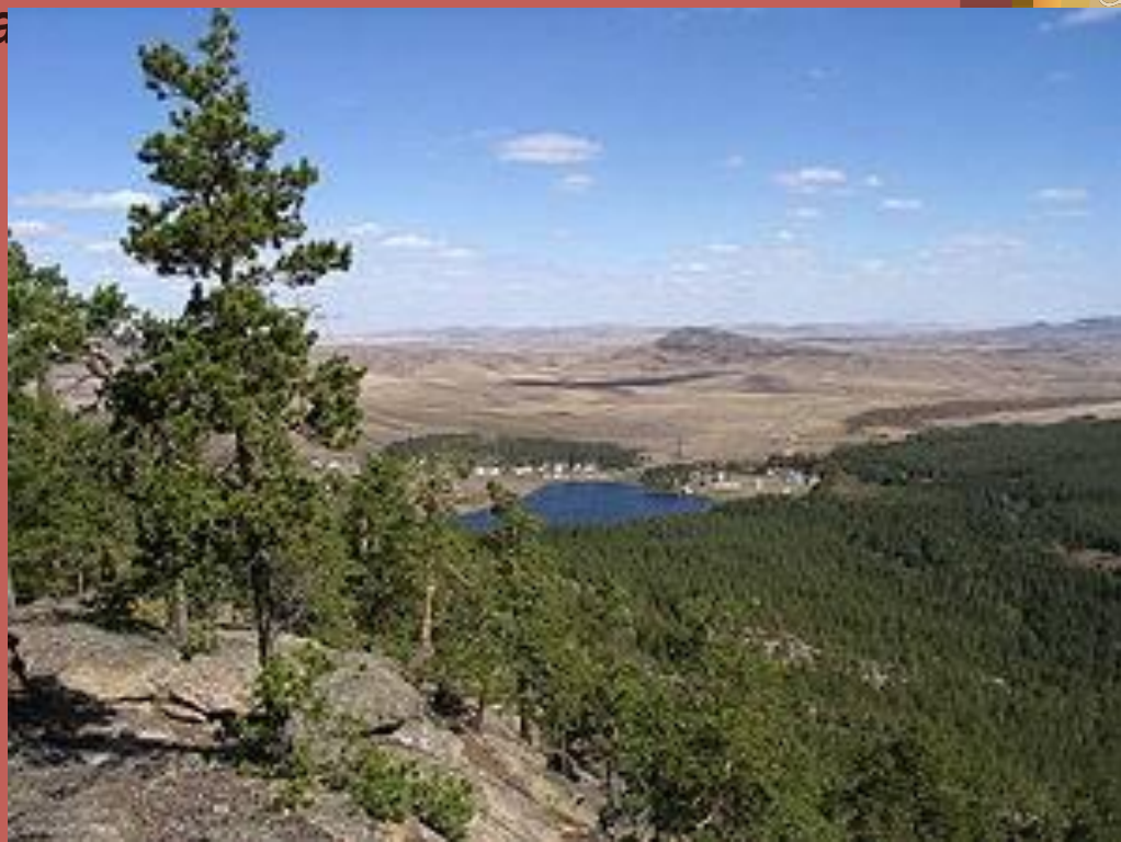
Каркаралинский национальный парк