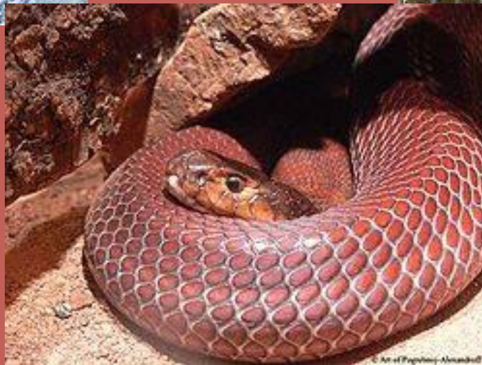
Красная плюющая кобра