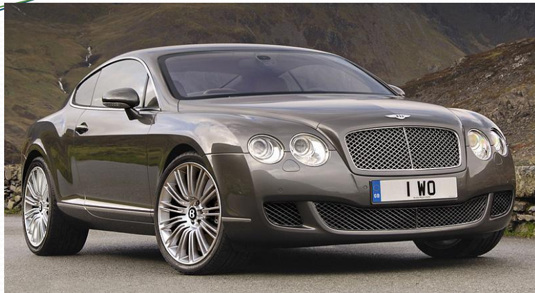
Bentley Continental GT