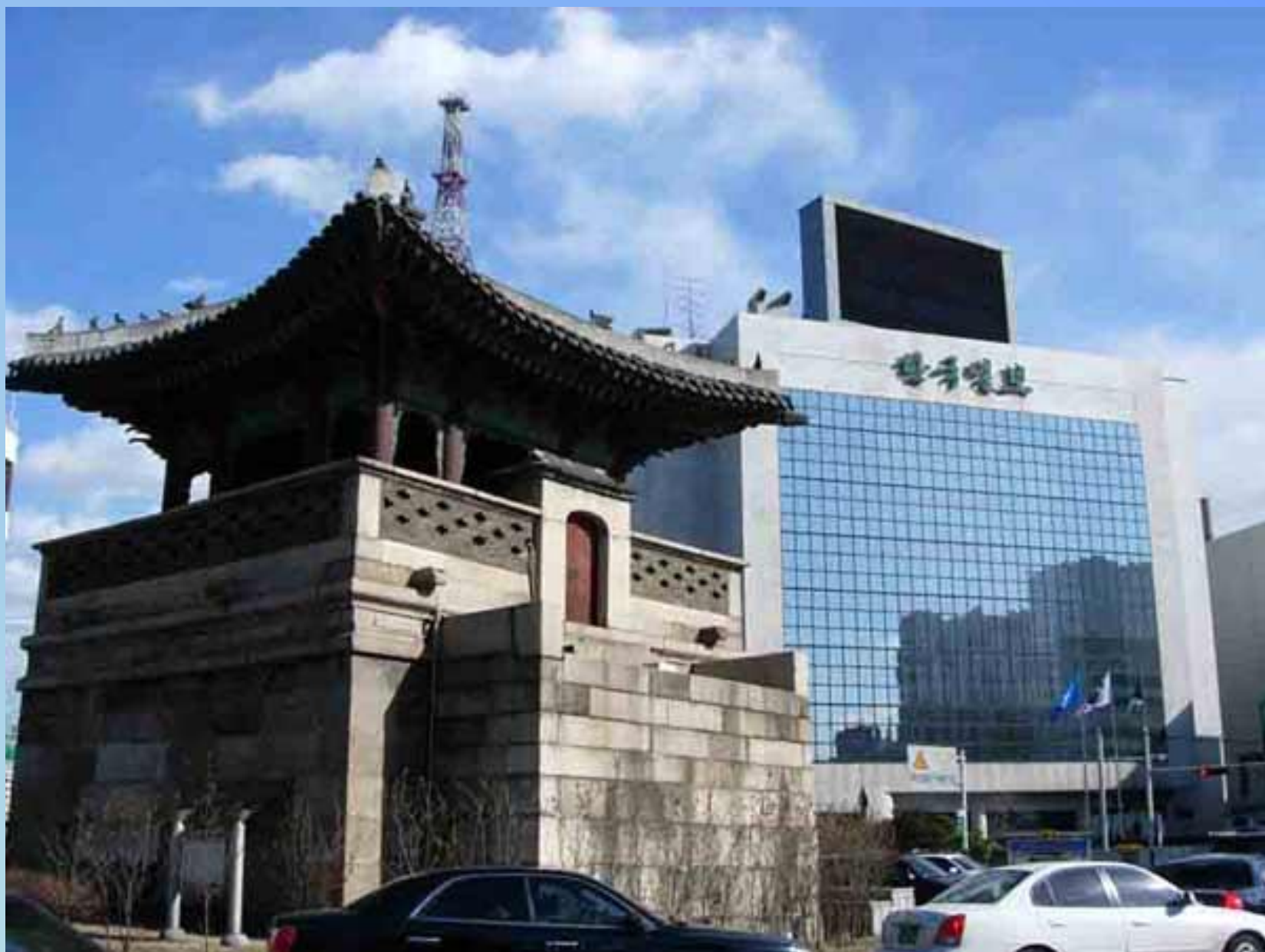
Сеул – столица Республики Кореи (10,7 млн. чел.).