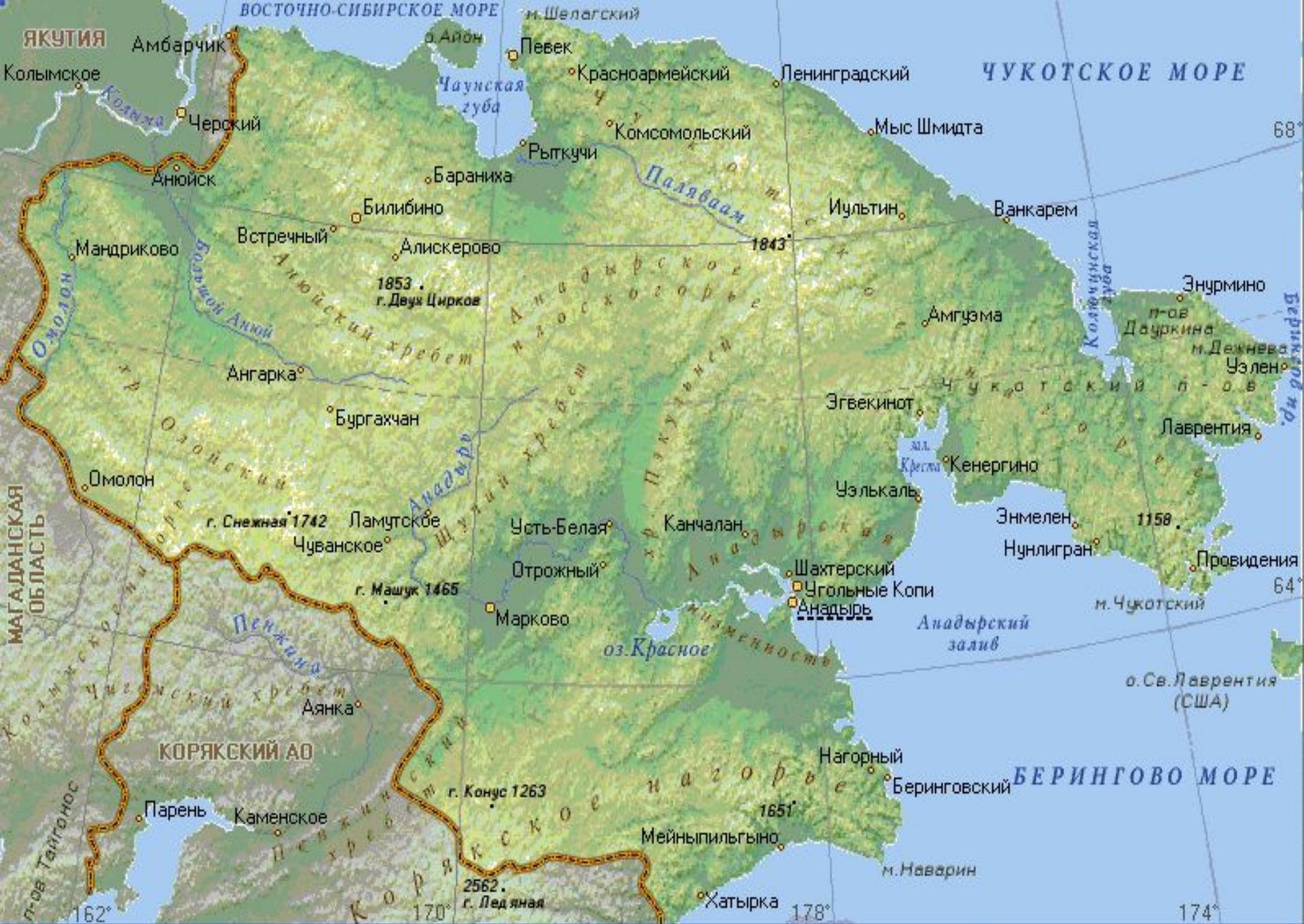
ЧУКОТСКИЙ АВТОНОМНЫЙ ОКРУГ