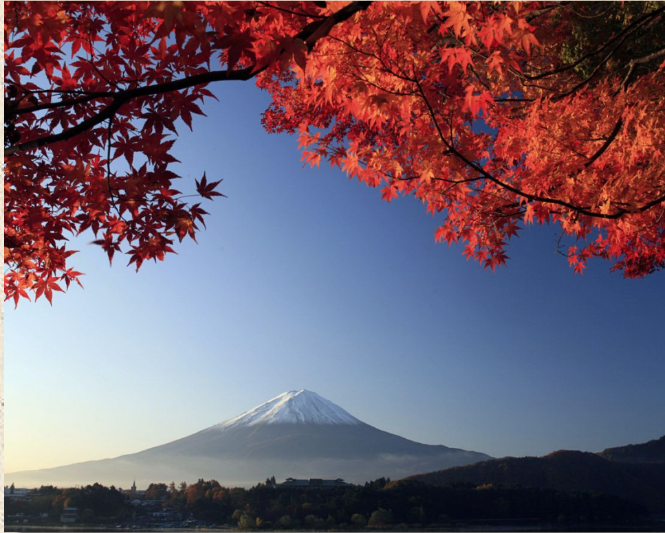
Фудзияма - высшая точка Японии.