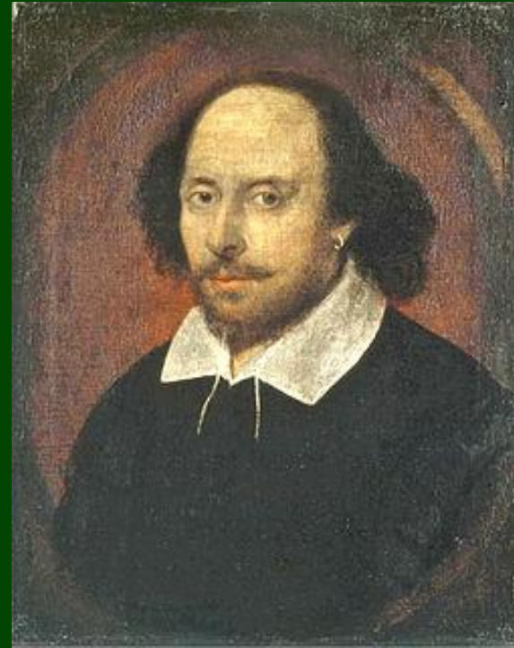
У. Шекспир, драматург XVI в.