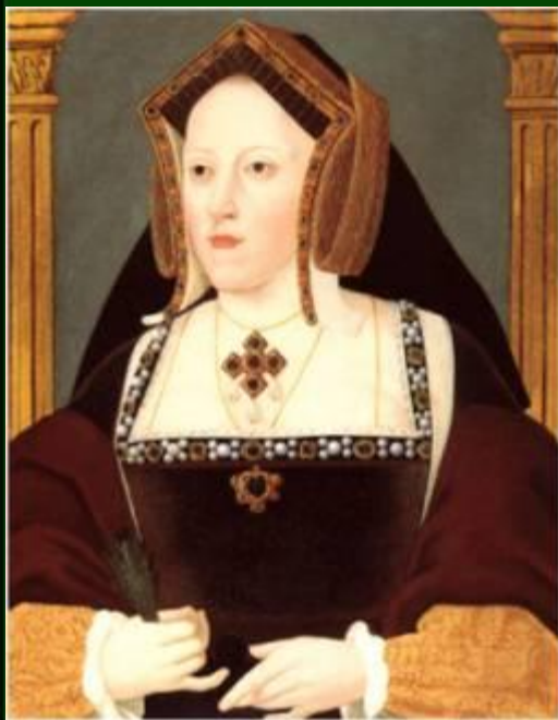
Екатерина Арагонская и Анна Болейн, жены Генриха VIII

От Екатерины Арагонской у Генриха VIII была только дочь Мария. В надежде получить сына, он решил развестись и жениться на Анне Болейн. Папа Римский отказал. Тогда в 1534 году в Англии был принят Акт о супрематии , который провозгласил короля Англии главой английской церкви.