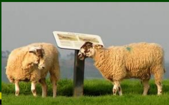
Овцы графства Корнуолл.