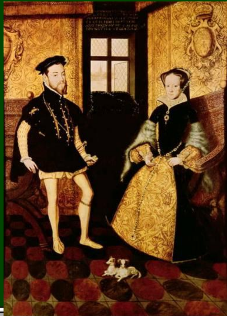
King Philip II and Queen Mary I, 1558 by Hans Eworth, Woburn Abbey, UK.