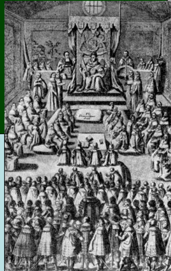
Заседание парламента при Елизавете. Гравюра XVI в.

Выборы: 2 рыцаря от каждого графства, 2 горожанина от каждого города