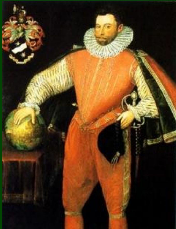
Френсис Дрейк, пират и адмирал и его флагман «Золотая Лань»