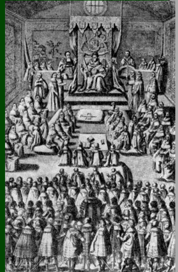
Заседание парламента при Елизавете. Гравюра XVI в.