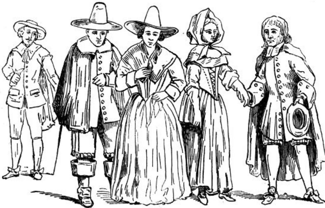
Пуритане, XVII в.