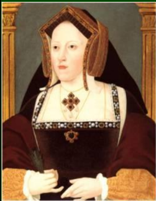
Екатерина Арагонская и Анна Болейн, жены Генриха VIII

От Екатерины Арагонской у Генриха VIII была только дочь Мария. В надежде получить сына, он решил развестись и жениться на Анне Болейн. Папа Римский отказал. Тогда в 1534 году в Англии был принят Акт о супрематии , который провозгласил короля Англии главой английской церкви.